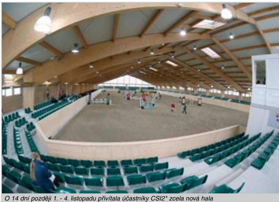
O 14 dní později 1. - 4. listopadu přivítala účastníky CSI2* zcela nová hala