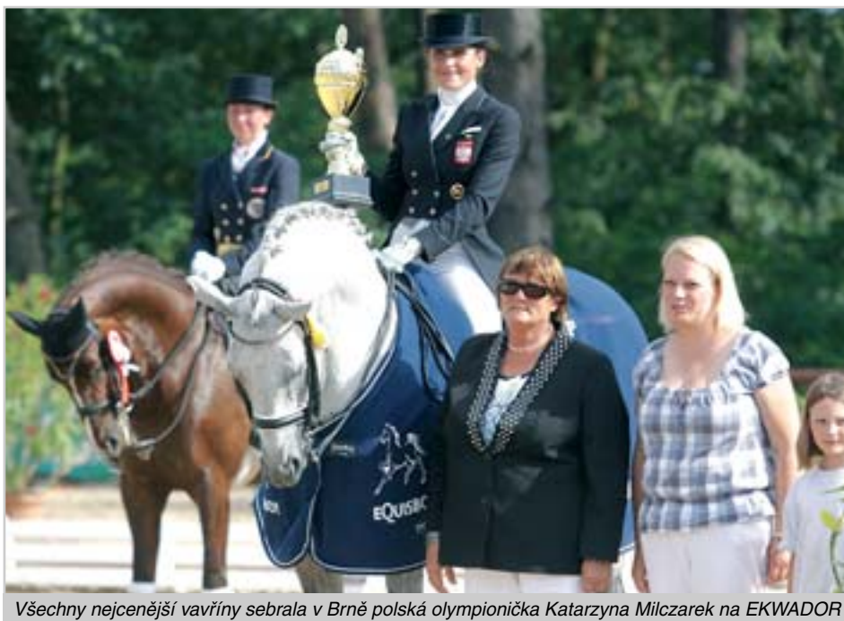
Všechny nejcenější vavříny sebrala v Brně polská olympionička Katarzyna Milczarek na EKWADOR