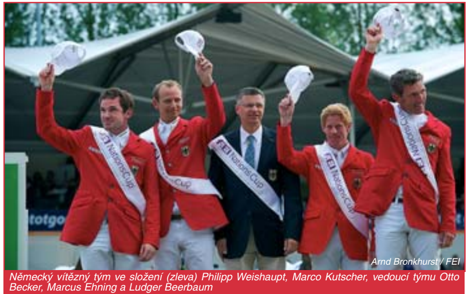
Německý vítězný tým ve složení (zleva) Philipp Weishaupt, Marco Kutscher, vedoucí týmu Otto Becker, Marcus Ehning a Ludger Beerbaum

Vítězství se čtyřmi body uhájili Němci ve složení Marcus Ehning COPIN VAN DE BROU (Darco) 9/4, Ludger Beerbaum GOTHA FRH (Goldfever) 0/1, Philipp Weishaupt MONTE BELLINI (Montender) 1/0, Marco Kutscher CORNET OBOLENSKÝ