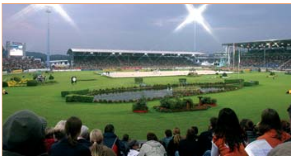
Po Světových jezdeckých hrách 2006 připravují pořadatelé v Cáchách další smělý projekt a v roce 2015 uspořádají sdružené ME v pěti disciplínách

(přesné datum bude oznámeno) 17. - 30. srpna 2015 10. - 13. září 2015 31. července - 2. srpna 2015 10. - 13. září nebo 17. - 20. září 2015