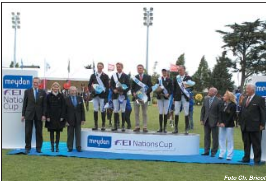
Vítězný tým Francie při prvním kole Superligy 2010 v La Baule

Druhé kolo Superligy bude v Římě v pátek 28. května.