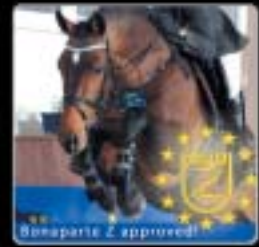
Bonaparte 2 approved!

Dovoz hřibat výborných původů za příznivé ceny!