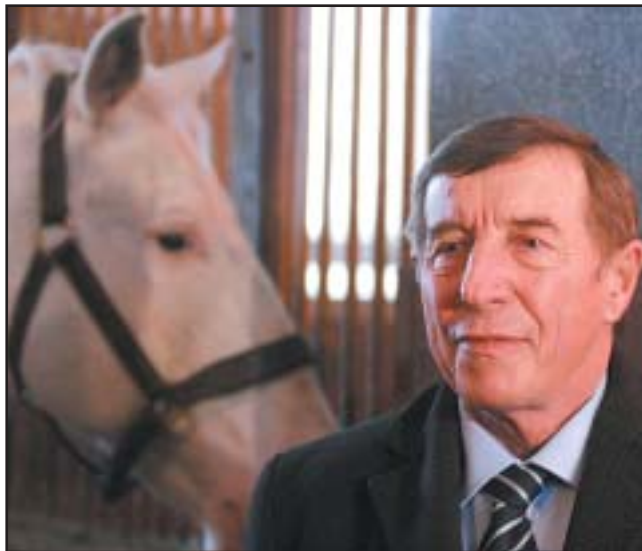
Ministr zemědělství Jakub Šebesta

Řada otázek směřovala k vyvrácení obav, že změna statutu NH ze státního podniku na státní příspěvkovou organizaci, může vést ke ztrátě majetku. Bylo opakovaně zdůrazněno, že se žádný prodej majetku nechystá a že případný odprodej nepotřebného majetku v příspěvkové organizaci je naopak výrazně komplikovanější. Prodej zdůvodněně nepotřebného majetku v tomto typu organizace podléhá kontrole nejenom ministerstva zemědělství (zřizovatel), ale i ministerstva financí. Navíc musí být takto uvažovaný přebytkový majetek přednostně nabídnut jiné státní organizaci.