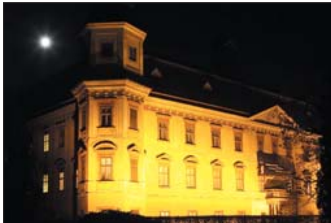
Zámek v Holešově hostil 20. listopadu Galavečer jezdeckého sportu Zlínské oblasti