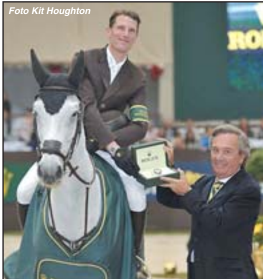
Další kolo západoevropské ligy Světového poháru získal v Ženevě Francouz Kevin Staut na SILVANA DE HUS

v kapse. Ohrozit už ho mohl jen mistr Evropy a úřadující světová jednička Kevin Staut s 11letou bělkou SILVANA DE HUS (Corland). Ten nasadil takové tempo, že se zdálo, že snad musí udělat chybu. To se ale nestalo a v cíli byl za bouřlivých ovací publika o patnáct setin rychlejší.