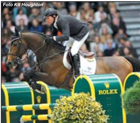
Třetí v turnaji TOP TEN skončil Kanadán Eric Lamaze na HICKSTEAD

Ve druhém kole zopakoval nelichotivý výsledek Pius Schwitzer a s celkovými dvaceti čtyřmi body skončil poslední. I tak si vysloužil velký potlesk a odvezl šek na 5 000 CHF. Devátá byla Edwina Alexander (7 000 CHF), která přidala ještě osm bodů. Bez chyby byl tentokrát Kevin Staut (10 000 CHF), ale jedenáct bodů z prvního kola znamenalo osmé místo.