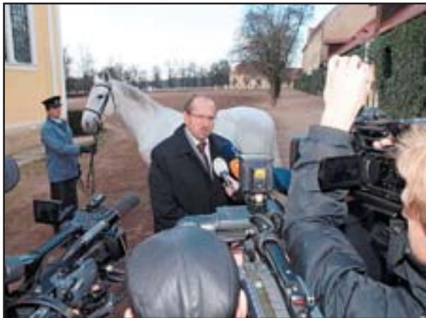
Ministr Zemědělství Ivan Fuksa na nádvoří v Kladrubech

V ní se ministr hlásí k úkolu dostat NH Kladruby na seznam světového kulturního dědictví Unesco. Dále by chtěl aby areál hřebčína sloužil jako „výkladní skříň“ resortu. Podpořil snahu o využívání starokladrubských koní při ceremoniálních příležitostech na Pražském hradě a chtěl by do Národního hřebčína přitáhnout i pozornost návštěvníků rozvojem turistického ruchu. Při této příležitosti zmínil jako příklad slovinský hřebčín v Lipici.