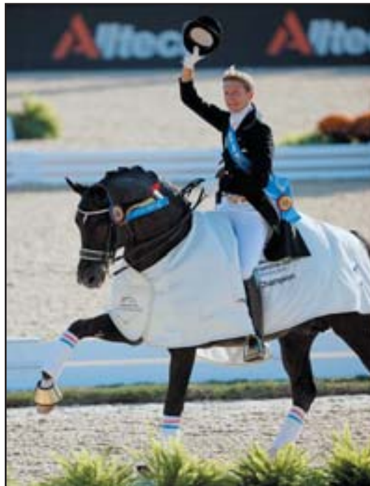
I v Kentucky byl TOTILAS uchvatný a opět vzbudil největší emoce

O stupínek výš s 80,000 %, skončila Isabell Werth se 14letým ryzákem WARUM NICHT FRH (Weltmeyer) a je jen velká škoda, že tato skvělá německá reprezen-