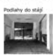
Podlahy do stájí