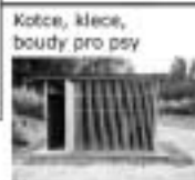
Kotce, klece, boudy pro psy