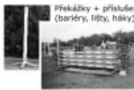
Překážky + příslušenství (bariéry, lišty, háky)