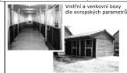
Vnitřní a venkovní boxy dle evropských parametrů

Jasná 4, 312 00 Plzeň tel+fax: 377 451 914 e-mail: ekvitan@ekvitan.cz http://www.ekvitan.cz