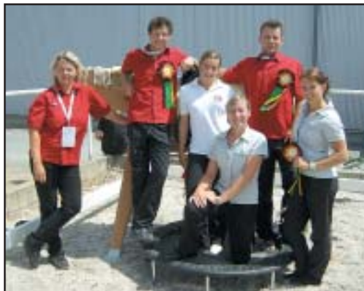
Český voltižní tým v Cáchách

V Cáchách bylo tentokrát tropické počasí