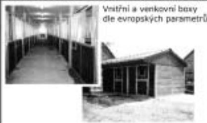
Vnitřní a venkovní boxy dle evropských parametrů