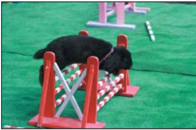
Pořadatelé hledají stále nové obohacení závodů, aby zaujali diváky. Při Bentley Praha Parkur Cup měli na českém kolbišti premiéru i parkur skákající králíci.