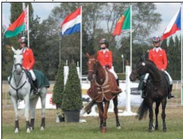
Čeští junioři, kteří dokončili šampionátovou soutěž ve Waregemu

Pokud mám hodnotit výsledky tak zřetelně zlepšení je vidět na drezurním obdélníku. V terénu se nám daří již tradičně. Největší problém se nyní skrývá zdravotní stav našich koní a závěrečný parkur. Mnozí naši jezdci byli překvapeni technickým kursem.