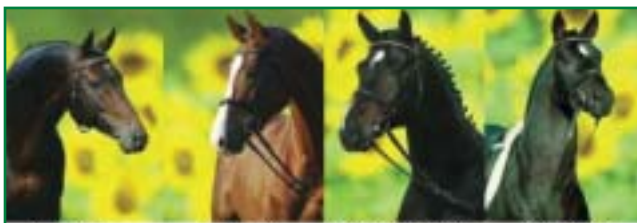
ROCKWELL LIGHT ON CONTINUS GRANNUS SHOW STAR