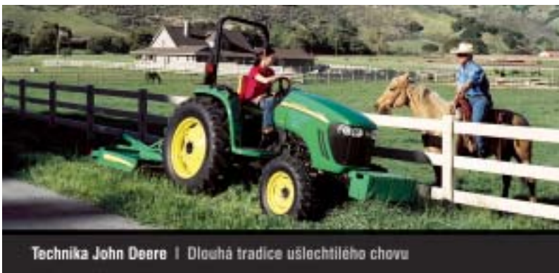
Technika John Deere | Dlouhá tradice ušlechtilého chovu

Druhým zduchovickým seriálem pak bude John Deer Tour 2008 o celkovou dotaci 600 000,- Kč, který je rozdělen do dvou částí Small a Big Tour. Finále John Deere Tour se bude konat v rámci Milionového víkendu ve Zduchovicích 6. září a z každé tour si vítěz odveze travní traktor v hodnotě 144 900,- Kč. Tři kvalifikační kola jsou pak na programu 12. - 13. dubna, 10. - 11. května a 14. - 15. června. Podrobná pravidla seriálů naleznete na nových stránkách společnosti www.kone-zduchovice.cz