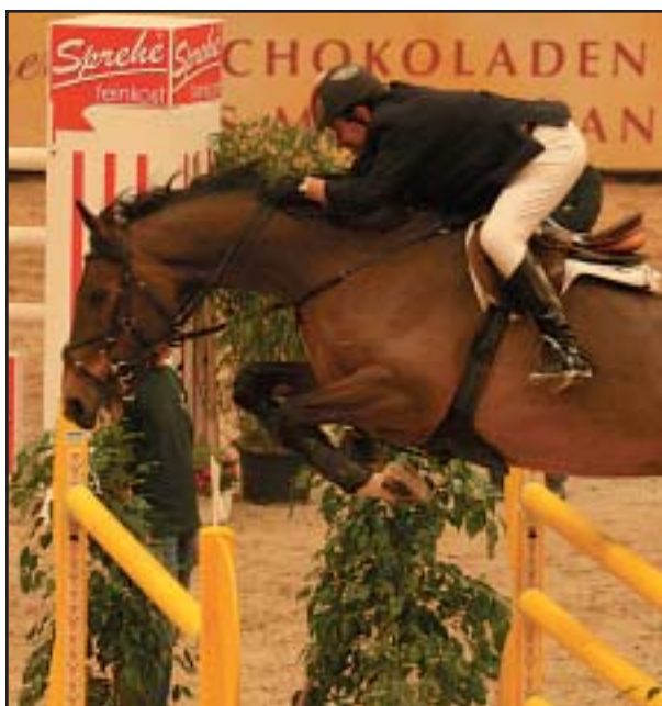
Nestárnoucí Hugo Simon (65) na CALDATO