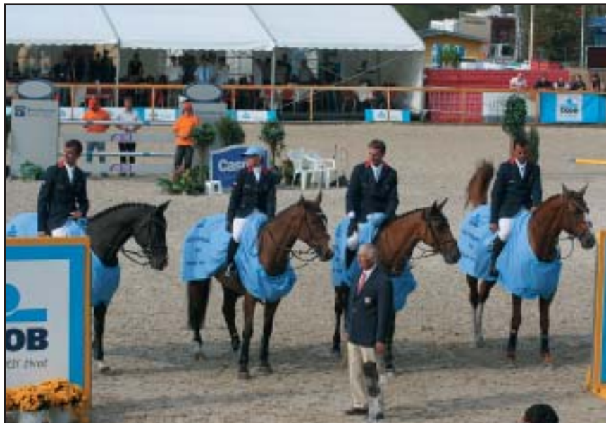
Vítězný francouzský tým pražského Poháru národů

Naopak své kvality potvrdily celky Francie a Itálie, kde téměř všechny dvojice absolvovaly i ztížené druhé kolo jistě a čistě nebo s jedinou chybou. Dařilo se i celku Velké Británie a tyto týmy zajistily pražskému Poháru dramatické vyvrcholení, kdy se o prvenství mezi třemi celky (shodně 12 tr. bodů) rozhodovalo v rozeskakování.