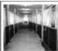
Vnitřní a venkovní boxy dle evropských parametrů

Jasná 4, 312 00 Plzeň tel+fax: 377 451 914 e-mail: ekvitan@ekvitan.cz EKVITAN PLZEŇ s.r.o. http://www.ekvitan.cz