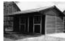
Vnitřní a venkovní boxy dle evropských parametrů

EKVITAN PLZEŇ s.r.o. Jasná 4, 312 00 Plzeň Tel./fax: 377 451 914 ekvitan@ekvitan.cz