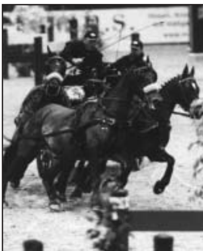
M. Freund opět kraluje

Světový pohár všestrannosti však teprve začíná a letos bude pokračovat ještě 15 soutěžemi. První je na programu 9.-12. března v Tallhassee v USA. Evropa vstoupí do seriálu 23.-26. března ve francouzském Fontaibleau. Zda se bude SP věnovat i tým z Horse Academy v Radimovicích nevíme. Otázkou je, jak se tyto soutěže budou hodit do přípravy na blížící se světový šampionát v Cáchách. Jak nám prozradili zástupci stáje, ten je v letošní sezóně hlavním vrcholem a přípravě na mistrovství světa bude vše podřízeno.