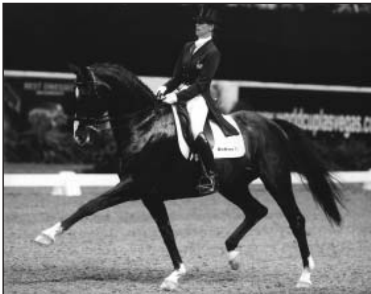
Anky van Grunswen (KELTEC SALINERO) je v současnosti na čele průběžného pořadí Světového poháru v drezúře

Cílem tohoto seriálu je připravit kvalitní dlouhodobou soutěž pro nejmladší talenty jezdeckého sportu. Jednotlivé soutěžní dny