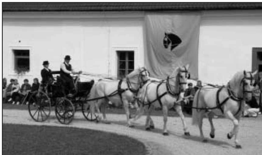
Přelom května a června byl ve znamení Dne koní. Zdařilou akci s tříhodinovým programem pořádali v hřebčíně Favory Benice v sobotu 3. června.