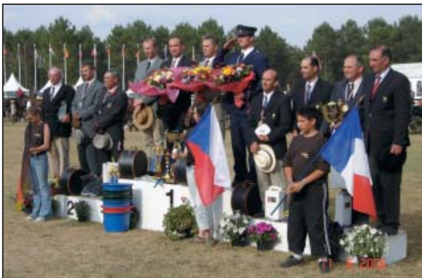
Historického úspěchu dosáhla česká dvojspréží v Alpsko-dunajském poháru 2006 v Saumuru