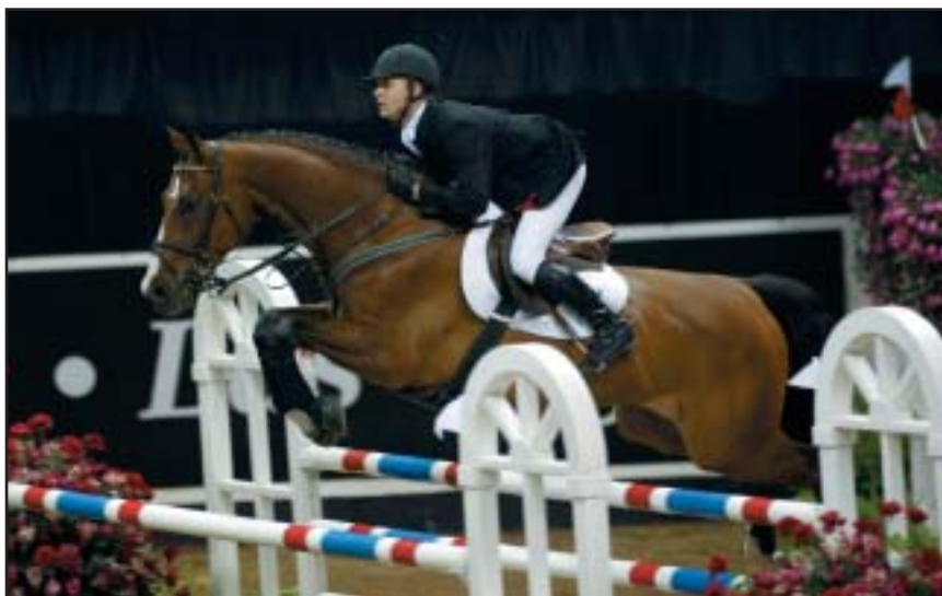
A. Opatrný již lasvegaskou halu zná a před dvěma lety v ní startoval na GRAND. Letos poleťte za moře s CRAZY LOVE.