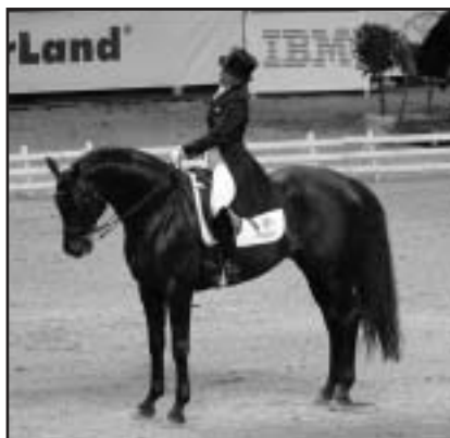
SYDNEY 2000 startující za ruskou stáj Pradar na drezúrním obdelniku