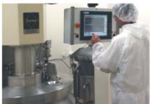
výrobu zajišťuje kvalifikovaný personál v nadstandardních podmínkách středních a výrobu léčiv

Před rozplněním zhomogenizovaných šarží se provádí mezioperační kontrola, na jejímž základě je dáno povolení k další fázi výroby. Po skončení výroby před uvolněním do prodeje jsou šarže opět laboratorně analyzovány a výsledky porovnávány s předepsanou specifikací daného výrobku. Sledují se senzorické vlastnosti, obsahy látek, homogenita a obsah mikroorganismů. Lze konstatovat, že výrobky značky Eliott ad us. vet. se řadí mezi vysoce kvalitní veterinární přípravky.