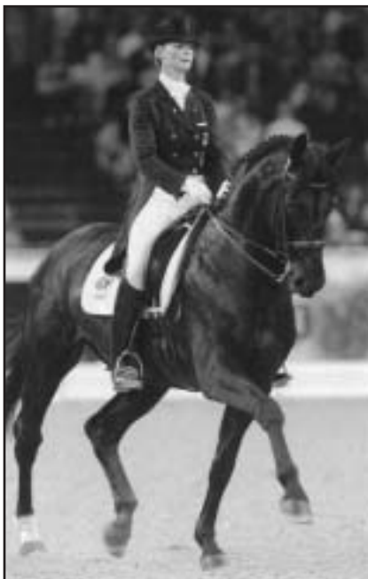
Vedoucí jezdčiny kvalifikace SP v drezúře je A.-K. Linsenhoff s WAHAJAMA Unicef

Celá společnost se pak ve dnech 26.-30. prosince opět setkala v belgickém Mechelenu při Flanderském Christmas Horse Show. Zde měl další kolo i halový SP čtyřspřeží. V sedmičce soutěžících si další