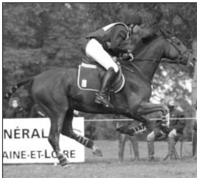
WIKI 1 P. Myšky bude v Humpolci hodnocen jako nejlepší kůň v KMK šestiletých