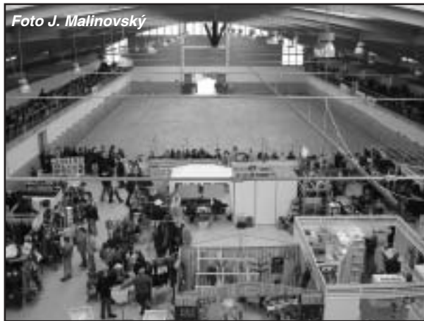
Již potřetí se hala na Císařském ostrově změnila na výstaviště

Květnovými závody na kolbišti Na Šabatce v Praze 4 Komořanech vstupuje na pražskou scénu nový pořadatel. JK Epona Praha zde 15. května pořádá drezurní závody, které budou prvními z pěti letošních střetnutí. V čele pořadatelství stojí R. Vikartová a zájemci mohou podrobnosti získat na tel.: 736 608 273.