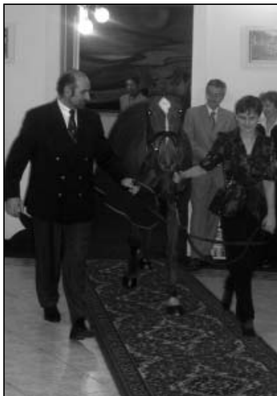
Kůň roku AMICUS K v zastoupení klisnou JUNICA