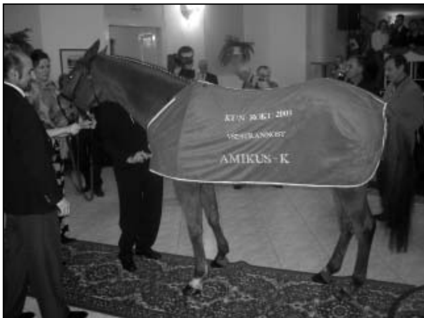
První galavečer jezdeckého sportu se uskutečnil 7. února v Humpolci. V sále kulturního domu nechyběl tentokrát ani živý kůň. Podrobnosti čtete na straně 2.