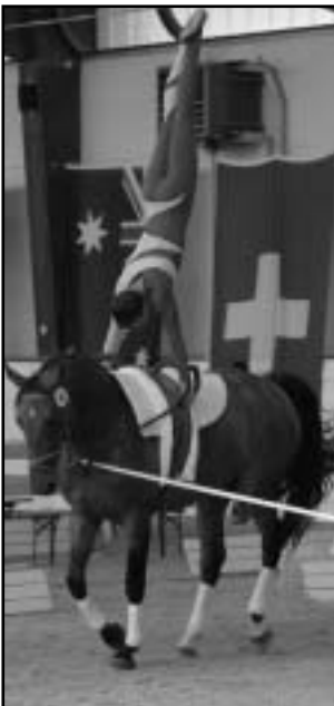
P. Eim – ESKADRA

V jezdeckém areálu v Hradci nad Moravicí proběhlo 8. srpna jezdecké klání. Dopoledne byly na programu ukázky chovatelských linií koní teplotkrevných a chladnokrevných, haflingů a pony. Odpoledne sportovní soutěže.