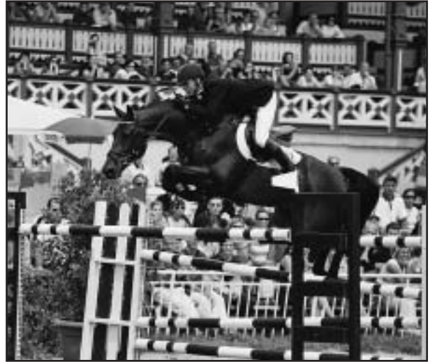
Mistrem ve skocích pro rok 2003 se stal opět A. Opatrný - SILVIO

Hned po skončení soutěže se pod vedením J. Skřivana sešli naši adeпти na reprezentaci, aby probrali nominace na CSIO Budapešť a CSIO Bratislava. Obou těchto soutěží se zúčastní ČR s tím, a tudíž nebudeme chybět v soutěži o Pohár národů.