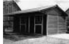
Vnitřní a venkovní boxy dle evropských parametrů

EKVITAN PLZEŇ s.r.o. Jasná 4, 312 08 Plzeň Tel./fax: 377 451 914