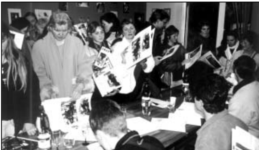
Jako filmové hvězdy si mohli naši reprezentanti připadat při autogramiádě Jezdeckého kalendáře roku 2002