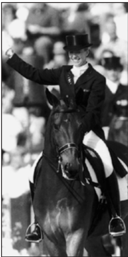
Anky van Grunsven a GESTION BONFIRE