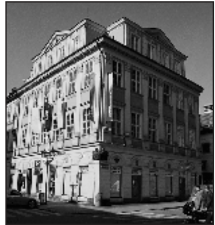
V domě se dvěma medvědy v Rytířské ulici v Praze sídlí nejen Maďarské kulturní centrum, ale i fotolab Profako, kde fandí koním

Děkujeme za rozhovor a zveme všechny fotografy do studia KODAK Expres Profako v Rytířské ulici 27 v Praze 1.