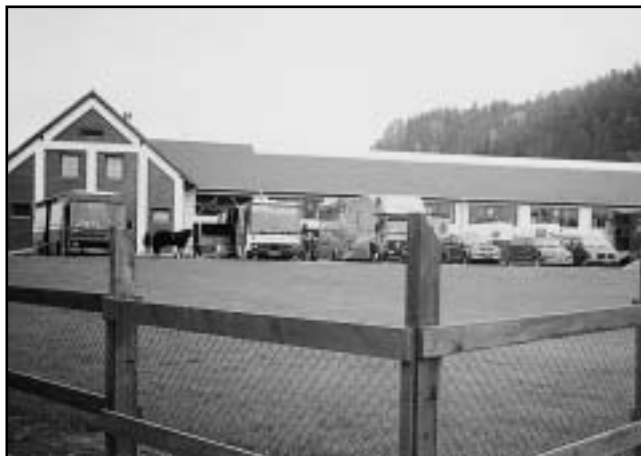
Zbrusu nový areál ve Všemilech má vše, co dokonalé jezdecké středisko potřebuje