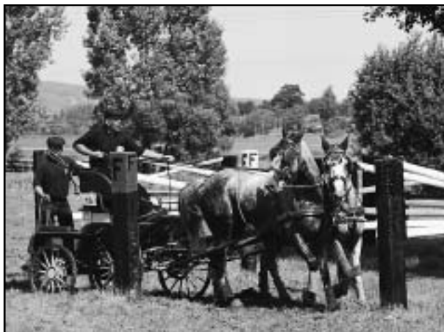
Celkovým vítězem se stal Maďar Zoltan Nyul