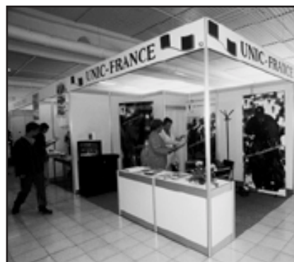
Obohacením letošního ročníku výstavy Kůň '99 byla účast Francie, která se tak stala partnerskou zemí a reprezentovala ji organizace UNIC (Union Nationale Interprofessionnelle du Cheval)