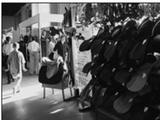
Bohatá nabídka spotřebního zboží pro jezdecký sport zaplnila celkem 1243 m 2