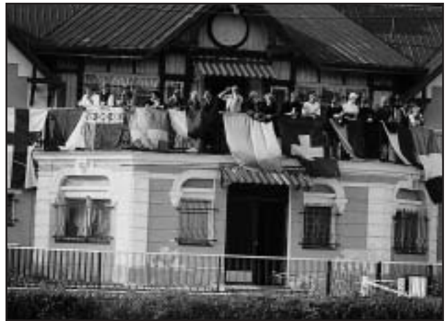
Tolik vlajek nezažila karlovarská vážnice ani při Mezinárodním mítinku socialistických států