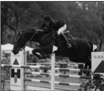
KRIS KENTAUR těší po úspěšném ME ve Švýcarsku své fanoušky i na domácí půdě

Náplastí nad neuskutečněným CSIO se v Praze na Trojském ostrově 19. září staly dobře dotované skokové závody o Podzimní pohár LUKO CZECH - NET. Hebký a letos dosud nedotčený trávník Trojského ostrova zatížily tři soutěže. V prvních dvou dominoval V. Tretera, který zvítězil nejprve ve dvoufázovém skákání 120/130 cm s NIKITOU a ve skokové soutěži do 130cm na čas pak s bělkou LUSLI. Zvláště tato soutěž svými 52 startujícími (20 bez tr. bodů) poukázala na celkovou zaplněnost střední skokové třídy v ČR.