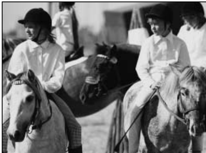
Při soutěžích v Mělníce pony nikdy nechybí